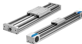
ベルト駆動スライダ