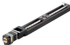
ボールねじスライダ