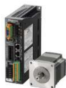
ステッピングモーター