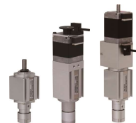
ピックアップユニット